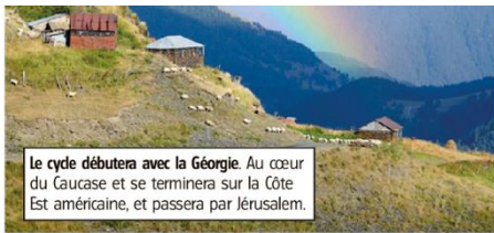
Le cycle débutera avec la Géorgie. Au cœur du Caucase et se terminera sur la Côte Est américaine, et passera par Jérusalem.