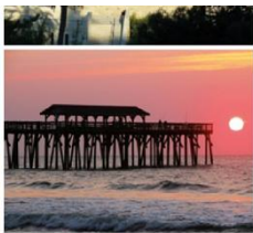
Exploration du monde