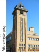
ÉdA - 2018/09/06/63