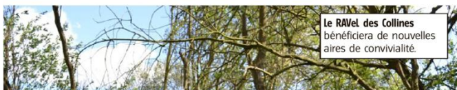
Le RAVel des Collines bénéficiera de nouvelles aires de convivialité.

À l'ordre du jour de la prochaine AG d'Ideta : dividendes aux communes, nouveaux