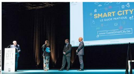
Eda - 40677208

« Notre centre de recherche - CIRCÉ, Creativity and Innovation Research Center – est associé à plu-