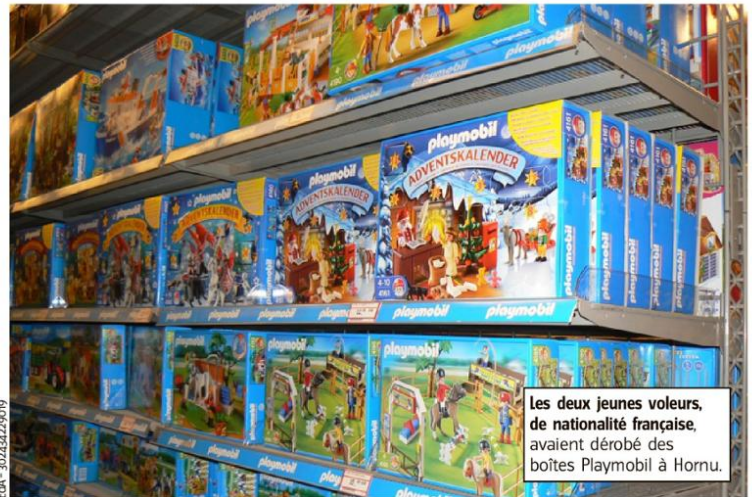
Les deux jeunes voleurs, de nationalité française, avaient dérobé des boîtes Playmobil à Hornu.

Une course-poursuite s'est alors engagée au cours de laquelle le conducteur prendra d'énormes risques pour échapper aux forces de l'ordre. Il brûlera des feux rouges, roulera à contresens tout en hésitant pas à monter sur des trottoirs.