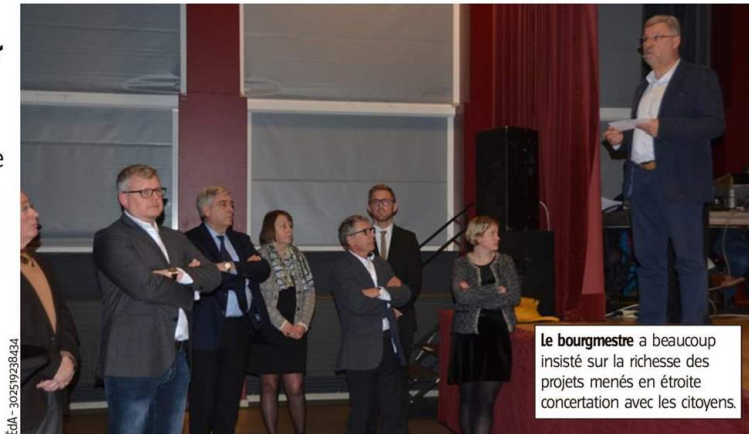
Le bourgmestre a beaucoup insisté sur la richesse des projets menés en étroite concertation avec les citoyens.

« On frôle les 14 000 habitants et l'an dernier, nos chiffres de population ont encore progressé de 1,7 %. Le nombre croissant de permis de bâtir témoigne d'une certaine attractivité. J'ajouterais les projets immobiliers qui fleurissent dans notre entité et répondent à des besoins de logements croissants. Tout cela participe à une politique volontariste de revitalisation de