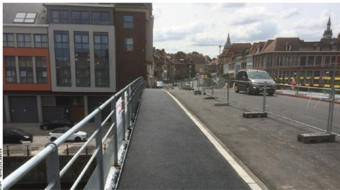
Désormais, on peut emprunter le pont à pied, dans les deux sens (les voitures ne peuvent circuler que dans un seul sens).

Les piétons peuvent bien entendu circuler dans les deux sens, ce qui n'est pas encore le cas pour les voitures qui ne peuvent emprunter le pont que dans le sens Dôme-Saint-Brice. Il faudra patienter jusqu'au 31 août pour que le pont rouvre dans les deux