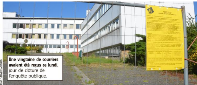
Une vingtaine de courriers avaient été reçus ce lundi, jour de clôture de l'enquête publique.

La surface de vente avoisinera, si les permis est accordé (NDLR : la Ville devra rendre son avis), les 1 400 m 2 pour l'enseigne Aldi