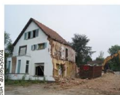
L'état de la bâtisse ce vendredi 8 juin.

abandonné mais les graffitis avaient pris possession des murs.