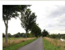
La plateforme bimodale, eau et route, doit occuper près de 1,5 ha en bordure de lys, près de l'entreprise Clarebout.

La réponse du maire n'a pas tardé : « Décidément, vous ne savez pas me parler face à face, il vous faut passer par les réseaux... Soit... La briquetterie de Deülémont existe depuis 1920 et on en est tellement fier que tous les ans nous lançons des briques du balcon de la mairie au pied de notre géant Oscar le Briquetoux et vous comparez les quelques centaines qui y sont entreposés avec un projet de chargement et déchargement de centaines de containers quotidiennement. »