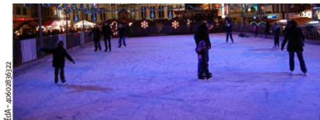
Cette année, les patineurs ne bénéficieront plus du cadre de la Grand-Place et de son hôtel de ville pour se laisser glisser sur la glace.

En raison des travaux de la Grand-Place, le syndicat d'initiative doit réfléchir à une nouvelle mise en place de son événement « Mouscron sur Glace ».