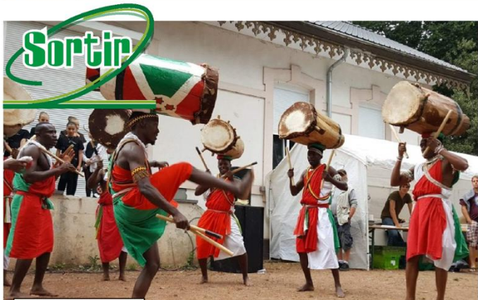
Le parc du Coron sera mis aux couleurs africaines à l'occasion de la 6 e édition du Festifaso.