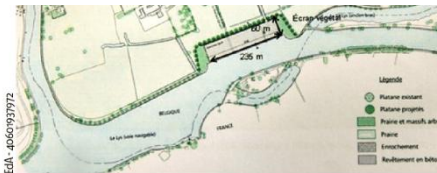
La plateforme bimodale, eau et route, doit occuper près de 1,5 ha en bordure de lys, près de l'entreprise Clarebout.

Même constat pour Yvon Pétronin, à Warneton France, où les élus se sont prononcés à l'unani-