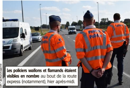
Les policiers wallons et flamands étaient visibles en nombre au bout de la route express (notamment, hier après-midi).

comme de la douane étaient encore visibles rues de Comines et du Manège.