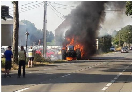
Le feu a pris de l'ampleur en quelques secondes.

G rosse pagaille sur la RN 60, entre Leuze et Bury, ce jeudi vers 18 h, à hauteur de Willaupuis, où un chargement de paille s'est embrasé sur une double remorque agricole.