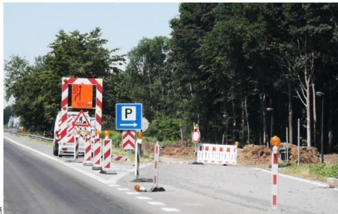
Les abords de l'aire de repos de Bourgambroy ont été déboisés avant la réalisation de travaux.

Sur l'aire de Bury (sens Tournai vers Mons) des aménage-