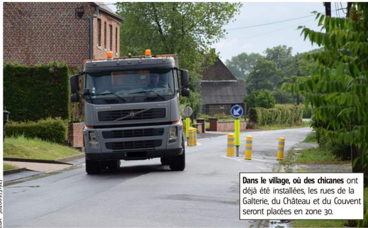
Dans le village, où des chicanes ont déjà été installées, les rues de la Galerie, du Château et du Couvent seront placées en zone 30.

Il y a quelques mois, les élus leuwois s'étaient penchés sur