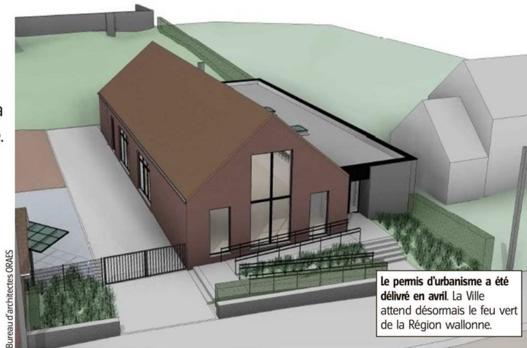
Bureau d'architectes ORAES

Il a donc été demandé au bureau d'architectes ORAES de revoir la voilure afin d'alléger