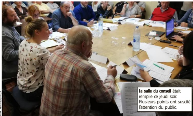
La salle du conseil était remplie ce jeudi soir. Plusieurs points ont suscité l'attention du public.