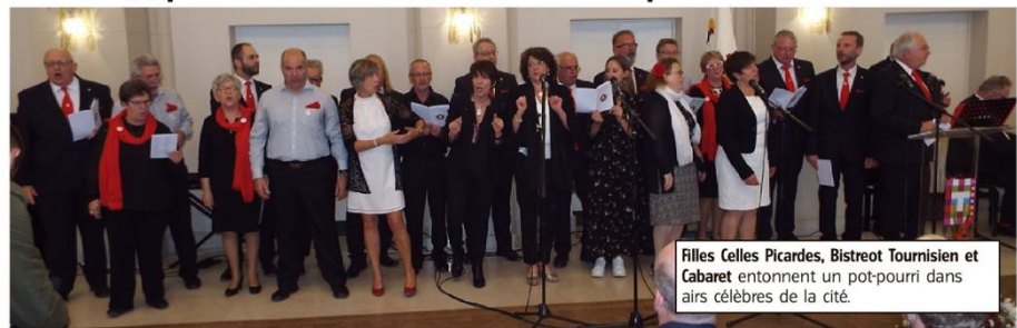
Filles Celles Picardes, Bistrot Tournisien et Cabaret entonnent un pot-pourri dans airs célèbres de la cité.

Cent dix ans, cela se fête et le Cabaret l'a fait durant trois heures avec les Filles Celles Picardes et le Bistrot tournisien.