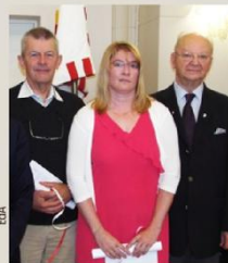
Le patois survit en ateliers ou sur scène. Trop peu au quotidien.