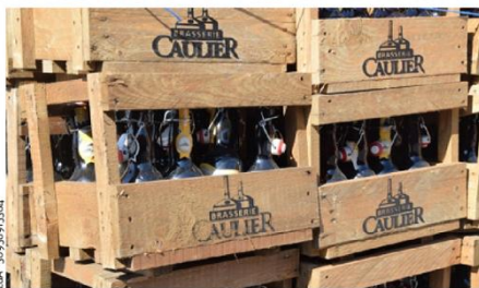
Les voleurs sont manifestement des amateurs de bonnes bières régionales.

Ce n'est vraisemblablement pas pour étancher une petite soif passagère que des voleurs ont jeté leur dévolu sur des produits de la brasserie Caulier, à Péruwelz, le week-end dernier. C'est en tout cas ce qu'il est permis de penser quand on apprend qu'ils ont emporté pas moins de 51 caisses de bière Boerken (une ambrée conditionnée en bouteilles de 33 cl) et 10 caisses de bouteilles de 33 cl de Bon Secours blonde.