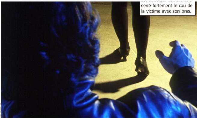
serré fortement le cou de la victime avec son bras.

glement. L'autre a alors tenté d'arracher le sac à main mais sans y parvenir dans un premier temps car la victime se débattait. Celle-ci est tombée in-