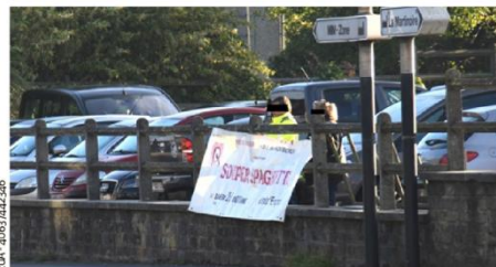
Hier, la SNCB coupait les colsons de la bâche annonçant le souper-spaghetti du Resto du cœur dont le bénéfice aidera les plus nécessiteux d'ici peu...

Tout en bas de la rue de la Station, l'enceinte du parking de la SNCB a toujours été une vitrine de choix pour diverses annonces. La visibilité y est optimale