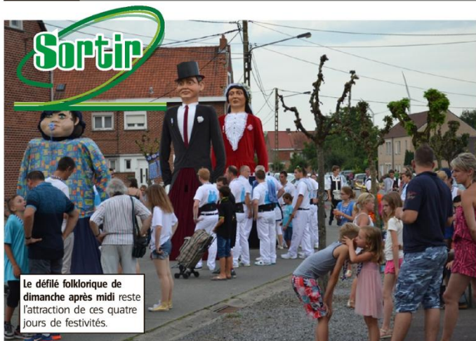
Le défilé folklorique de dimanche après midi reste l'attraction de ces quatre jours de festivités.