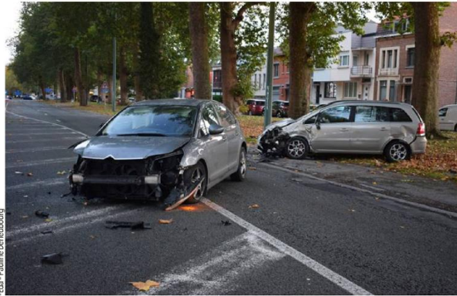
-Eda - Pauline Deneubourg