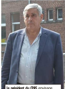
Le président du CPAS envisage d'attaquer le plaignant pour diffamation.

« C'est de la folie furieuse, a réagi le président du CPAS, qui dément catégoriquement les accu-